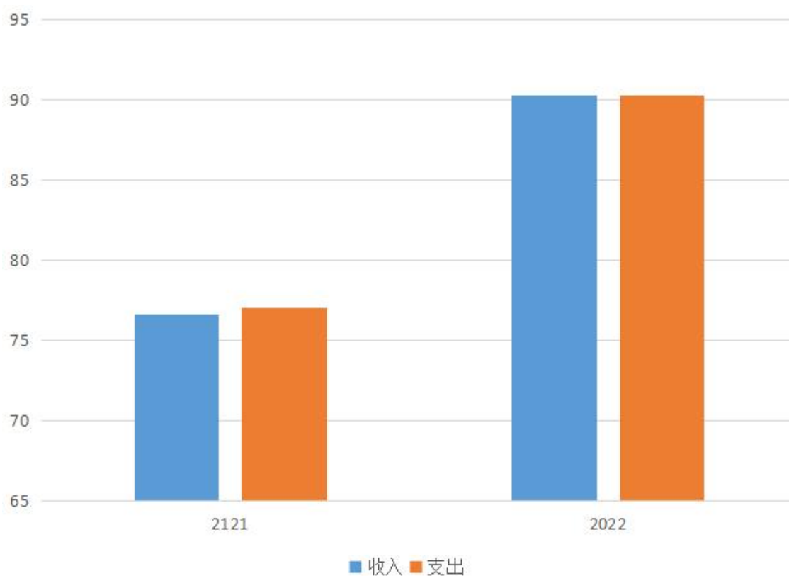
图 3.4.1 财政拨款收入支出决算总体情况

2022 年度财政拨款收入总计、支出总计均为 90.31 万元，与上年相比收入总计、支出总计各增加 13.24 万元，增长 17.17%。主要原因是随着业务量增加，会议费、培训会、办公经费等增加。